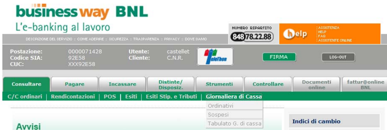
(Fig. n. 10)

Selezionando il menu “ Giornaliera di Cassa ” la procedura propone la consultazione delle funzioni sottoriportate.